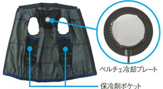
ペルチェ冷却プレート